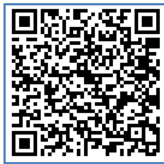
有馬 直弘（ありま なおひろ）